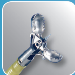
Radial Jaw 4 Увеличенный объём