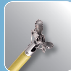
Radial Jaw 4 Педиатрические