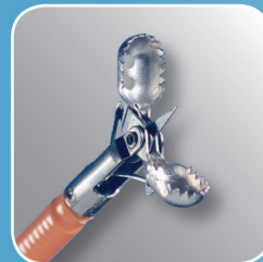
Radial Jaw 4 Jumbo