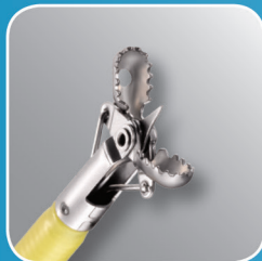
Radial Jaw 4 Стандартный объём