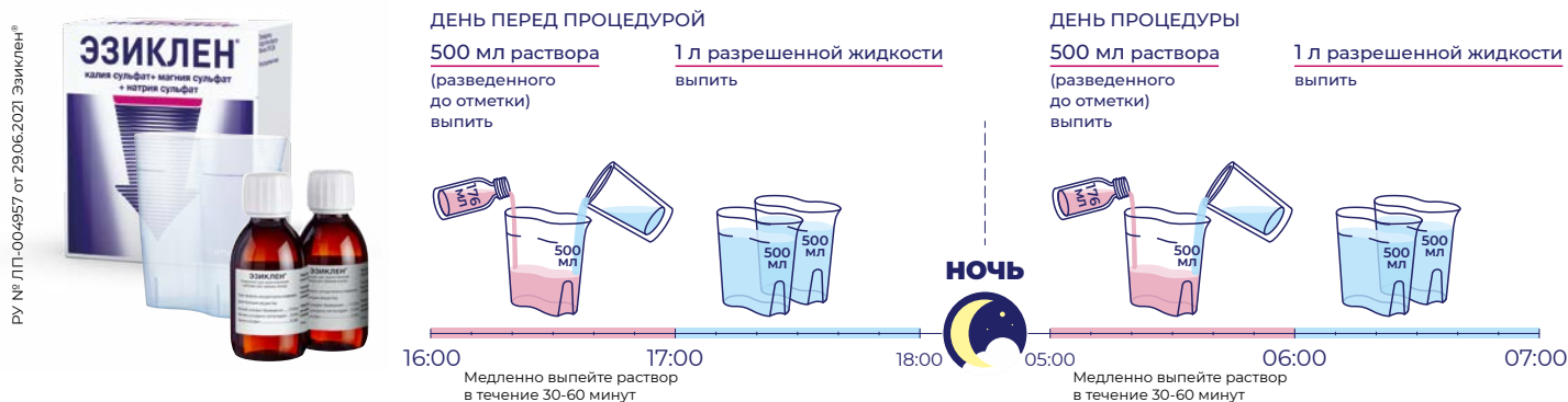
Схема ДВУХЭТАПНОГО приема препарата, если колоноскопия назначена на ПЕРВУЮ половину дня (до 13:00)*

Схема приема препарата в режиме дробного применения в случае, если процедура назначена, например, на 10 часов утра