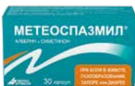
РУ № П N013069/01 от 05.11.2020 Метеоспазмил®

Применение препарата Метеоспазмил® может облегчить процедуру колоноскопии за счет уменьшения спазма кишки, избыточного газообразования и пенистого секрета, а также способствует уменьшению вздутия, боли в животе — проявлений реактивного кишечного дискомфорта после процедуры 4